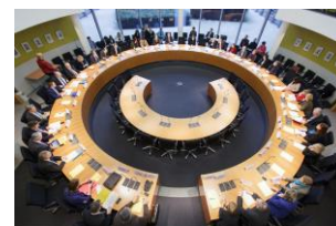
Der Gesundheitsausschuss tagt

Ausnahmsweise fand die Sitzung meines Ausschusses bereits am Dienstagabend und nicht wie üblich am Mittwochvormittag statt. Grund für die Vorverlegung war der dringende Handlungsbedarf bei den Gesetzen zur Beschleunigung von Asylverfahren – auch bekannt als „Asylpaket II“. Ein Ziel ist neben schnelleren Asylverfahren die Festlegung weiterer sicherer Herkunftsstaaten.