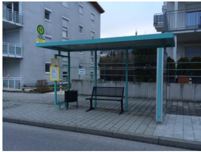
Der Bund unterstützt den regionalen ÖPNV mit 350.000 €

Die vom Land geförderte Regiobus-Verbindung DonauBodensee, die ab März Sigmaringen mit Überlingen verbindet, ist eine große Errungenschaft. Sie bindet Pfullendorf, Krauchenwies, Herdwangen-Schönach und Owingen an das überregionale Verkehrsnetz an. Ich freue mich darüber, dass meine Bemühungen, Fördergelder des Bundes in den Landkreis zu bringen, Früchte getragen haben. Im Rahmen des Bundesprogramms „Langfristige Sicherung von Versorgung und Mobilität im ländlichen Raum“ bewilligte der Bund 350.000 Euro Fördergelder, um in der Gemeinde Herdwangen-Schönach und weiteren Gemeinden im Wahlkreis bedarfsorientierte Verkehrsangebote zu ermöglichen. Als Einwohner und langjähriger Bürgermeister von Herdwangen weiß ich besonders gut um die Schwächen des hiesigen öffentlichen Verkehrsangebots. Deshalb ist die Unterstützung des Bundes so wichtig.