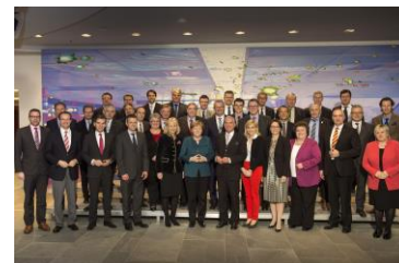
Die Mitglieder der Landesgruppe mit Bundeskanzlerin Dr. Angela Merkel im Kanzleramt

Angela Merkel hat die Landesgruppe Baden-Württemberg ins Kanzleramt eingeladen. Bei dem Treffen stand das Thema Flüchtlinge im Mittelpunkt unserer Diskussion. Die Kanzlerin machte deutlich, dass das Recht auf Asyl von Seiten Deutschlands nur zeitlich befristet gewährt werden wird. Sie erinnerte daran, dass nach dem Krieg in den 90er Jahren auf dem Balkan nahezu alle Flüchtlinge in ihre Heimat zurückkehrten.