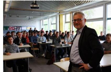
Lothar Riebsamen MdB mit einer Klasse der Jörg-Zürn-Gewerbeschule in Überlingen

Anlässlich des EU-Projekttag habe ich die Jörg-Zürn-Gewerbeschule besucht, um mit Schülern der 12., 13. und Berufskollegs-Klasse über TTIP, Flüchtlingskrise und Böhmermann zu diskutieren. Der EU-Projekttag geht auf eine Initiative von Bundeskanzlerin Angela Merkel zurück. Seit 2007 bietet er Schülerinnen und Schülern in ganz Deutschland die Gelegenheit, sich intensiv mit der europäischen Einigung zu beschäftigen. Bundesweit gehen Vertreter der Bundesregierung als auch Mitglieder des Bundestages sowie des Europäischen Parlaments an die Schulen ihrer Wahlkreise. Ich freue mich, wenn Schüler an aktuellen politischen Themen sind. Von Politikverdrossenheit war an diesem Morgen wenig zu spüren. Es ist sehr wichtig, junge Menschen für Politik und besonders für die europäische Einigung zu begeistern.