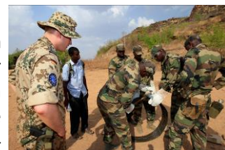
Deutsche Soldaten bilden malische Soldaten im Rahmen der European Union Training Mission to Mali (EUTM) im Koulikoro Trainingscenter aus.

Seit Herbst 2015 hält der Waffenstillstand zwischen Rebellen und Regierung in Mali, dennoch ist der malische Staat noch nicht in der Lage, sein Staatsgebiet vollständig zu kontrollieren. Die deutschen Kräfte leisten im Rahmen der EU-Ausbildungsmission EUTM Mali einen Beitrag zur Wiederherstellung der militärischen Fähigkeiten der malischen Sicherheitskräfte. Diesen Einsatz haben wir nun um ein Jahr verlängert. Die Mandatsobergrenze haben wir von 350 auf 300 Soldaten gesenkt.