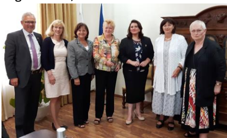
Die Delegation aus Deutschland in Malta

In der vergangenen Woche reiste ich mit der deutsch-maltesischen Parlamentariergruppe nach Malta. Schwerpunkt der Reise war die Flüchtlingskrise. An Ort und Stelle hatten wir Gelegenheit, uns unter anderem mit der Präsidentin Marie Louise Coleiro Preca und Außenminister George W. Vella, über die Situation in Libyen, die EU-Präsidentschaft Maltas im Jahr 2017 und die bilateralen Beziehungen unserer beiden Länder auszutauschen. Die Staatspräsidentin machte deutlich, dass der von Deutschland eingeschlagene Weg einer europäischen Lösung der Flüchtlingsthematik der richtige wäre. Malta ist in ganz besonderer Weise darauf angewiesen, dass die EU entschlossen gemeinsam handelt. Der Inselstaat ist seit 2004 Mitglied der EU. Das Land ist mit rund 500.000 Einwohnern das kleinste in der Europäischen Union. Die Inselgruppe erstreckt sich auf 316 km 2 .