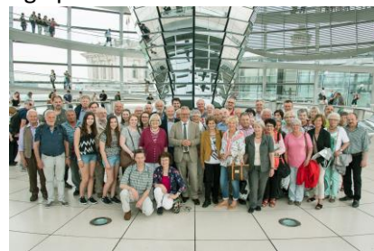
Die Besucher und Lothar Riebsamen MdB auf der Dachterrasse des Reichstagsgebäudes

Bürgerinnen und Bürger aus dem Wahlkreis, unter anderem von der Landjugend Aach-Linz und einer Gruppe aus Herdwangen-Schönach nahmen das Angebot einer politischen Informationsreise nach Berlin wahr. Als Bundestagsabgeordneter biete ich die Möglichkeit, pro Jahr drei Gruppen á 50 Teilnehmer nach Berlin einzuladen. Ziel dieser Fahrten ist, den Bürgern politische Inhalte zu vermitteln und über demokratische Abläufe zu informieren. Entsprechend stramm war das Programm: Neben einem Besuch im Reichstag und einer Diskussion mit dem Abgeordneten bot auch das Rahmenprogramm jede Menge politische Informationen und Anregungen. Auf dem Plan standen eine Führung in der Gedenkstätte Deutscher Widerstand, ein Besuch des Jüdischen Museums und zwei politisch orientierte Stadtrundfahrten. Höhepunkt war die abendliche Spreefahrt.