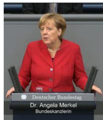
Bundeskanzlerin Dr. Angela Merkel bei Ihrer Rede zum Bundeshaushalt 2017

In ihrer Rede verteidigte die Bundeskanzlerin ihren politischen Kurs. Deutschland geht es so gut wie seit langem nicht mehr. Wir sind der Wachstumsmotor in Europa. Auch im Bereich der Flüchtlingskrise hat die Bundesregierung viel erreicht. Nicht nur das Asylpaket I und II sind hierfür ein Beweis. Die Bundesregierung wird auch weiterhin Lösungen für die Flüchtlingskrise, suchen, sowohl auf nationaler Ebene, als auch in enger Zusammenarbeit mit unseren Partnern in Europa und der Welt.