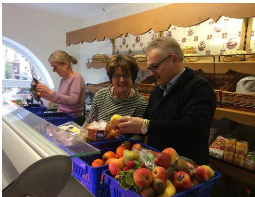
Aktiv Mithelfen bereitet große Freude!

In der vorletzten Woche besuchte ich die Tafel in der Hofener Straße in Friedrichshafen, um dort einen Vormittag lang aktiv mitzuhelfen. Besonders beeindruckt hat mich dabei das ehrenamtliche Engagement der dort tätigen Menschen. Hierfür möchte ich mich bei allen in diesem Bereich Tätigen recht herzlich bedanken! Es ist schön, wenn sich Menschen, denen es nicht so gut geht, auf ihre Mitmenschen verlassen können. Sehr interessant fand ich zudem auch das System, mit welchem der Zugang zur Tafel geregelt wird, um in der Lage zu sein, möglichst vielen helfen zu können.