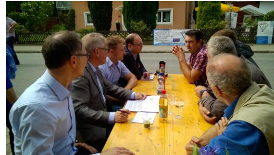
Im Gespräch mit betroffenen Landwirten