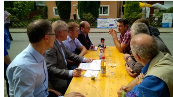
Im Gespräch mit betroffenen Landwirten