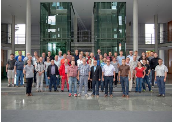
Die Teilnehmer der BPA-Fahrt im Paul-Löbe-Haus

In der vergangenen Woche konnte ich die Teilnehmer meiner ersten diesjährigen Abgeordnetenfahrt hier in Berlin begrüßen. 50 Mitglieder von Feuerwehren aus dem gesamten Wahlkreis waren meiner Einladung zu einer Abgeordnetenfahrt gefolgt, mit der ich mich bei den Teilnehmern für ihr ehrenamtliches Engagement bedanken möchte. Neben dem Besuch im Reichstag standen u.a. auch eine politische Stadtrundfahrt sowie eine Spree-Schiffahrt auf dem Programm der Fahrt.