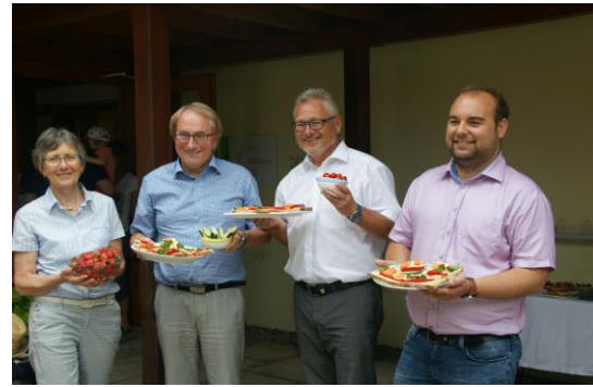
Mit gesunden Speisen in die Lesepause

Das Kinderhaus Sonnenschein in Mühlhofen hatte jüngst doppelten Grund zur Freude: einerseits wurde es für seine bewusste Kinderernährung ausgezeichnet und erhielt das entsprechende „ BeKi-Zertifikat “. Andererseits überreichte ich den Kindern und ihren Betreuern eine Bücherkiste mit kindgerechten Büchern. Hierfür ließ ich bei einem lokalen Buchhändler ein Paket mit Lesematerial zusammenstellen. Den Kindern und Betreuern wünsche ich viel Vergnügen beim Vorlesen und Lesen. Im Anschluss an den offiziellen Teil ließen wir uns einige Kostproben des gesunden Essens schmecken. Vielen Dank dafür – es war sehr lecker!