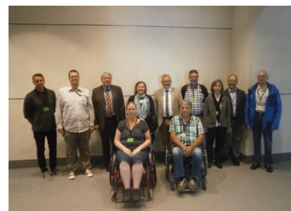
Vor dem Gespräch im Reichstag

Am heutigen Freitag trafen sich, auf meine Vermittlung hin, zehn Schwerbehinderten-Vertreter aus dem Wahlkreis mit dem Beauftragten der CDU/CSU-Fraktion im Bundestag für Menschen mit Behinderung, Uwe Schummer MdB , zu einem Gespräch und Gedankenaustausch im Reichstagsgebäude. Einige Vertreter trafen sich zudem noch mit dem früheren Behindertenbeauftragten der Bundesregierung, Hubert Hüppe MdB .