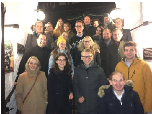
Die „Schnitzeesser“ der JU Bodenseekreis