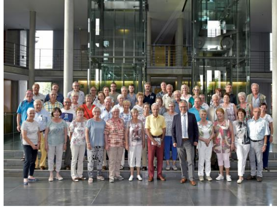
Die Teilnehmer der Fahrt mit mir im Paul-Löbe-Haus

In dieser Woche konnte ich die erste von drei Abgeordnetenfahrten , die es in diesem Jahr geben wird, hier in Berlin begrüßen. Die Teilnehmer dieser vom Bundespresseamt (BPA) organisierten Fahrt für politisch interessierte Bürger absolvierten von Sonntag bis Mittwoch ein straffes, aber interessantes Programm in der Hauptstadt. Neben dem Besuch hier im Bundestag