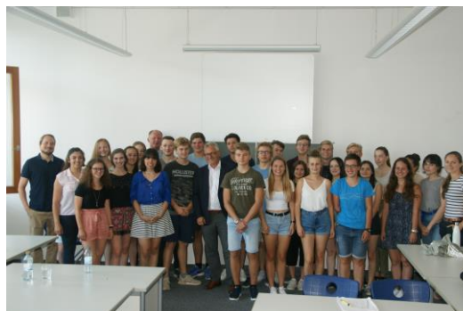
Mit den Schülern des GZG in Friedrichshafen

Am Donnerstag der letzten Woche war ich – fast schon traditionell – zu Besuch am Graf-Zeppelin-Gymnasium in Friedrichshafen. In der Diskussion mit den Schülerinnen und Schülern der Neigungsfächer Gemeinschaftskunde und Wirtschaft ging es unter anderem um die Themen Europa, Asylpolitik, Pflege, die Steuerpolitik , aber auch um meinen Alltag als Bundestagsabgeordneter unseres Wahlkreises. Es war sehr erfreulich, mit den politisch interessierten Schülern engagiert zu diskutieren und