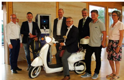
Auf „E“ geht's los!

Bereits zum vierten Mal fand zu Beginn der letzten Woche das Bermatinger Energieforum statt. Bei der – gemeinsam vom CDU Kreisverband Bodensee und von der CDU Bermatingen organisierten – Veranstaltung standen die unterschiedlichen Mobilitätsformen im Bereich der Elektromobilität im Mittelpunkt. Interessant waren dabei vor allem die vorgestellten Modellprojekte aus dem Bodenseekreis. Das große Potenzial