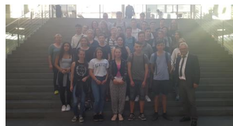
Mit den Schülern im Paul-Löbe-Haus

Heute besuchte mich die Klasse 10b der Bodenseeschule St. Martin im Rahmen ihrer Abschlussfahrt. Nach einer einstündigen Diskussion „schossen“ wir noch ein Foto, bevor es für die Klasse zum Informationsvortrag im Plenarsaal und auf die Kuppel ging.