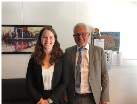
Herzlich willkommen im Team!