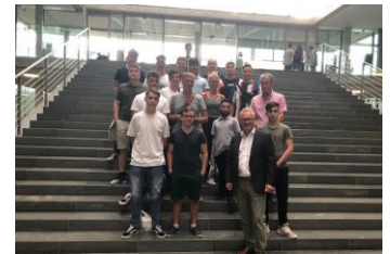
Mit den Schülern im Paul-Löbe-Haus

Am heutigen Abend traf ich die Schülerinnen und Schüler der Klassenstufe 9 der Pestalozzischule aus Friedrichshafen zu einem Gespräch im Paul-Löbe-Haus. Nach dem Gespräch ging es für die Klassen nach einem kurzen Fotostopp zum Abendessen in das Besucherrestaurant des Bundestags.