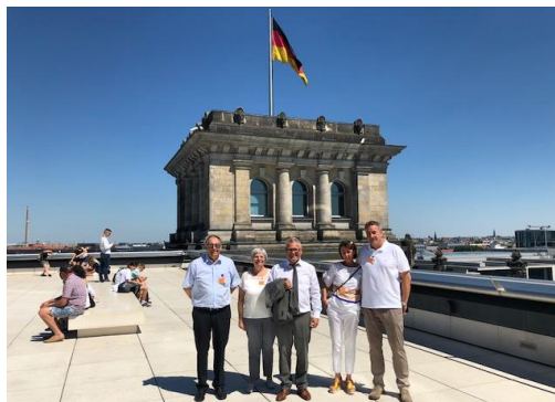
Gute Stimmung bei den Besuchern