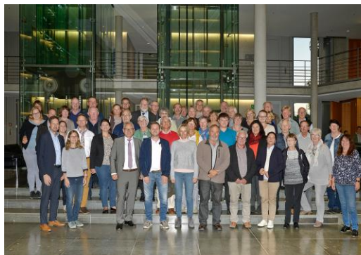
Die Teilnehmer der Fahrt mit mir im Paul-Löbe-Haus

Drei Mal im Jahr kann jeder Bundestagsabgeordnete jeweils 50 Bürger seines Wahlkreises zu einer Bildungsfahrt nach Berlin einladen. In dieser Woche waren es vor allem politisch Interessierte Menschen vom Bodensee, die meiner Einladung gefolgt und nach Berlin gekommen sind. Neben dem bereits erwähnten Besuch des Bundestags standen auch die CDU-Parteizentrale im Konrad-Adenauer-Haus, das ehemalige Stasi-Gefängnis in Berlin-Hohenschönhausen sowie eine politische Stadtrundfahrt auf dem Programm.