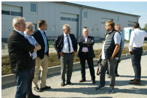
Vor dem „Haus zum Teuringer“

Als direkt gewählter Abgeordneter gehört es auch zu meinen Aufgaben, mich über die Städte und Gemeinden meines Wahlkreises auf dem Laufenden zu halten. So besuchte ich in der letzten Woche die Gemeinde Oberteuringen. Unter anderem besichtigte ich dort das „Haus zum Teuringer“ – ein inklusives Mehrgenerationenprojekt. Außerdem besuchte ich noch den lokalen Traditions-Fensterbaubetrieb Schrodi, wo insbesondere