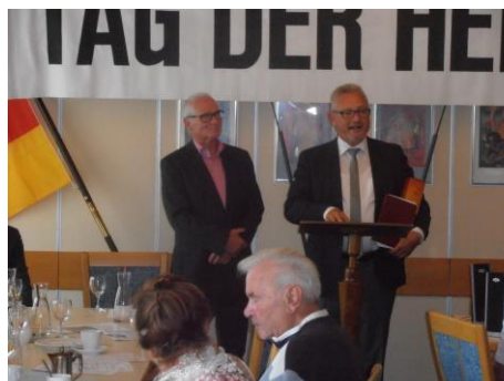
Beim Tag der Heimat

Am Samstag, den 29. September war ich Festredner beim dies-jährigen Tag der Heimat des Bundes der Vertriebenen und der Landsmannschaft der Oberschlesier im Bodenseekreis . In meiner Rede im Gasthaus „Waldhorn“ in Manzell ging ich dabei einerseits auf den großen Beitrag der Heimatvertriebenen, also Integration in eine völlig neue Umgebung sowie den Verzicht auf Gewalt ein. Andererseits beleuchtete ich auch die Unrechts-