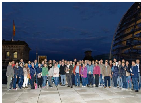
Die Teilnehmer der Fahrt vor der Reichstagskuppel

Zur letzten der drei politischen Bildungsfahrten in diesem Jahr hatte ich Mitglieder der Narrenzünfte aus dem Wahlkreis nach Berlin eingeladen. Ohne Häs, aber trotzdem gut gelaunt, begaben sich gut 50 Narren auf die Erkundung der politischen Bühne in der Hauptstadt . Am Montagabend trafen wir uns im Reichstag zu einem Gespräch bzw. zur Diskussion, bevor der Abend bei einem Essen sowie einem Bier im Hofbräuhaus am Alexanderplatz ausklang. Besonders freute ich mich über ein Buch zur Fasnet und ein