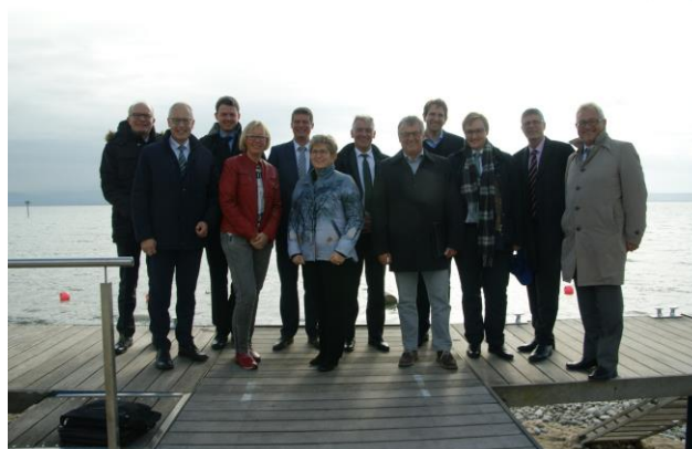
Die Mitglieder der AG Kommunalpolitik am See

Einmal im Jahr treffen sich die Mitglieder der AG Kommunalpolitik der CDU/CSU-Fraktion im Deutschen Bundestag zu einer Klausurtagung . Diese findet immer an einem anderen Ort statt, weshalb ich mich sehr freute, meine Kollegen in diesem