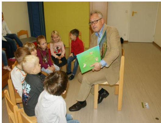
Die Kinder hörten sehr aufmerksam zu.

Lesen und insbesondere auch Vorlesen ist von großer Bedeutung für die Entwicklung von Kindern. Daher ist es inzwischen eine schöne Tradition, dass ich mich am großen bundesweiten Vorlesetag , der jedes Jahr am 16. November stattfindet, beteilige. In diesem Jahr las ich den Kindern des Kindergartens in Friedrichshafen-Berg aus der Bilderbuchgeschichte „Wir sind