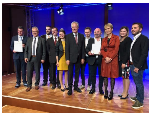
Gruppenfoto mit den Preisträgern

Jeden Herbst findet in der baden-württembergischen Landesvertretung eine Leistungsschau der Winzerbetriebe aus unserem Bundesland statt. Im Zuge dieser Veranstaltung werden auch stets die besten Weine ausgezeichnet. In diesem