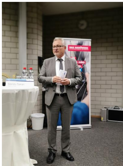
In der Bildungsakademie in FN

Der Fachkräftemangel macht sich inzwischen auch bei uns am See bemerkbar. Daher ist es sehr erfreulich, dass das Thema bei den Verantwortlichen angekommen ist! In der letzten Woche