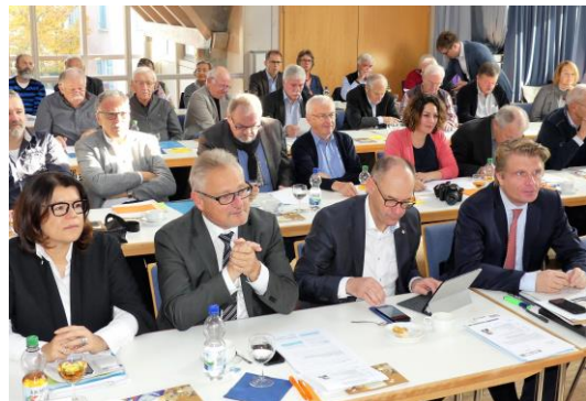
Voll besetzte Reihen in Bambergen

Am vorletzten Wochenende trafen sich die Mitglieder der CDU aus dem Bodenseekreis zu einem Parteitag mit einer völlig neuen Zielsetzung. Denn dieses Mal standen keine Wahlen auf der Tagesordnung, sondern die inhaltliche Ausrichtung unserer Partei . Das neue Format hatte die „Zukunftswerkstatt“, die aus engagierten Parteimitgliedern bestand, beschlossen. So wurden