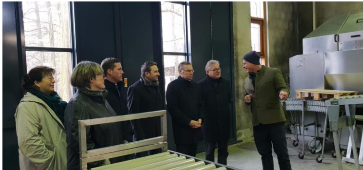
Mit Norbert Lins und Manuel Hagel beim Betriebsrundgang

Auf Initiative des Stettener Winzers Manfred Aufricht trafen sich hochrangige Vertreter der CDU, um über die Problematik eines möglichen Schweizer Endlagers in unmittelbarer Nähe der Grenze zu Deutschland zu diskutieren. So waren neben mir auch der Generalsekretär der CDU Baden-Württemberg, Manuel Hagel , der Europaabgeordnete Norbert Lins und der CDU-Kreisvorsitzende Volker Mayer-Lay sowie weitere Vertreter der CDU der Einladung gefolgt.