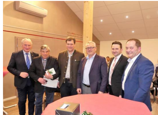
Bei der Ehrung langjähriger Mitglieder

Einen gelungenen Auftakt in das Kommunalwahljahr 2019 wählte die CDU Langnau/Laimnau. Am vergangenen Freitag war ich im schönen Argental zu Gast und rief die Kandidatinnen und Kandidaten dazu auf, mit vollem Schwung in den Wahlkampf zu gehen. Gerade in Anbetracht der aktuellen Herausforderungen wie Brexit, Klimawandel oder der schwindenden Bedeutung der Volksparteien in Europa ist es umso wichtiger, sich politisch zu engagieren. Ich freue mich daher, dass die CDU Langnau/Laimnau mit nun 76 Mitgliedern eine neue Mitglieder-Bestmarke aufstellen konnte.