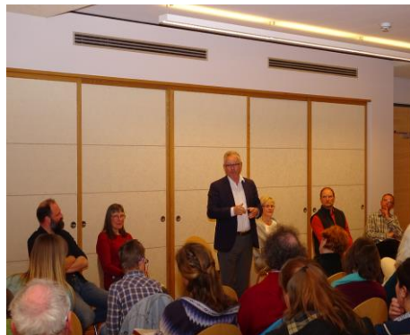
Bei der Diskussion in Frickingen

In der vergangenen Woche war ich zu einer Podiumsdiskussion darüber eingeladen, ob die Untersuchung von Embryos im Mutterleib auf bestimmte Krankheiten in Zukunft von den Krankenkassen bezahlt werden soll , oder nicht. Besonders wertvoll waren dabei die Erfahrungen von unmittelbar Betroffenen . Ein zentraler Punkt, in dem sich alle Teilnehmer in Frickingen einig