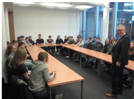
In reger Diskussion

Schulklasse der Bodenseeschule St. Martin zu Besuch