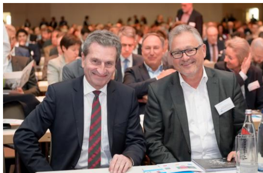
Mit Günther Oettinger auf dem DRG-Forum

Seit fast 20 Jahren findet mit dem so genannten DRG-Forum eine wichtige Diskussionsplattform sowohl für Krankenhausmanager als auch für Entscheidungsträger aus Politik, Wirtschaft, Verbänden und Wissenschaft statt. In diesem Jahr war das Forum erneut im Estrel-Hotel in Berlin-Neukölln zu Gast. Insgesamt rund 150 Referenten und über 1500 Teilnehmer sorgten für eine sehr