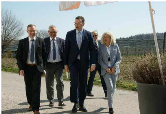
Mit Jens Spahn auf dem Weg ins Hopfenmuseum

Am vergangenen Freitag stattete Bundesgesundheitsminister Jens Spahn MdB unserem Wahlkreis einen Besuch ab. Auf Einladung der CDU Tettngang stellte sich Spahn im – aus allen Nähten platzenden – Hopfenmuseum in Siggenweiler bei einem gesundheitspolitischen Mittags-Treffs den durchaus auch kritischen Fragen der weit über hundert Bürgerinnen und Bürger.