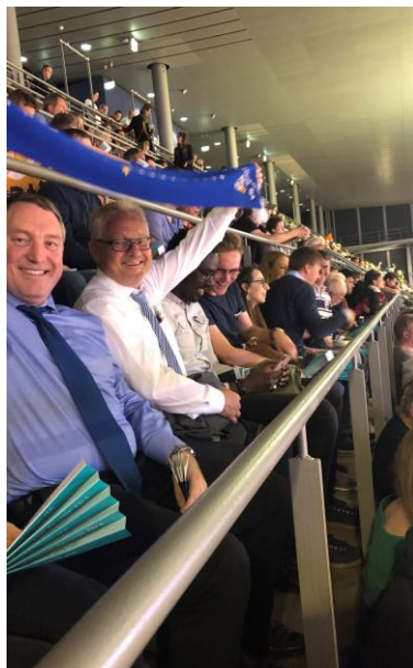
Beim Spiel in der Max-Schmeling-Halle

Am Mittwochabend fand in Berlin das vierte Spiel der Finalrunde der Volleyball-Bundesliga statt. Da mit dem VfB Friedrichshafen sowohl eine Mannschaft aus meinem Wahlkreis als auch der Rekordmeister und Rekordpokalsieger bereits heute die Chance hatte, Deutscher Meister zu werden, nutzte ich die günstige Gelegenheit, um mit meinen Mitarbeitern einen kleinen Betriebsausflug in die Max-Schmeling-Halle zu machen.