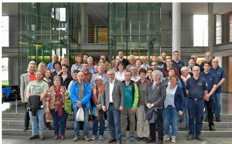
Mit den Teilnehmern der BPA-Fahrt im Paul-Löbe-Haus

Im Rahmen des – auf der vorhergehenden Seite bereits erwähnten – Besuches der jüngsten so genannten BPA-Fahrt nutzten wir im Anschluss an das Gespräch die Gelegenheit für ein gemeinsames Erinnerungsfoto im Paul-Löbe-Haus.