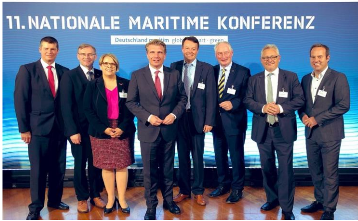
Die Vertreter unserer Region bei der Maritimen Konferenz