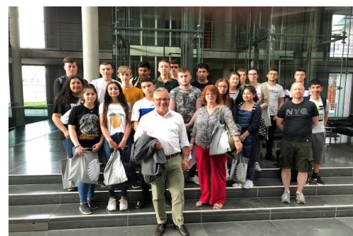
Mit den Schülerinnen und Schülern aus Pfullendorf

Kurz vor Beginn der Pfingstferien besuchten mich die Schülerinnen und Schüler von zwei Schulen aus meinem Wahlkreis. Am Dienstagnachmittag begrüßte ich die neunte Klasse der Sechslindenschule aus Pfullendorf , während ich am Donnerstagabend mit über 60 Schülerinnen der Klosterschule Wald über die aktuelle Politik diskutierte.