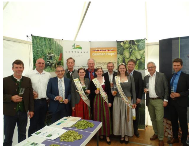
Bei der Leistungsschau in Tettngang