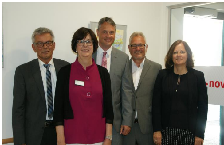
Geballte Gesundheits- und Pflegekompetenz bei der Eröffnung.