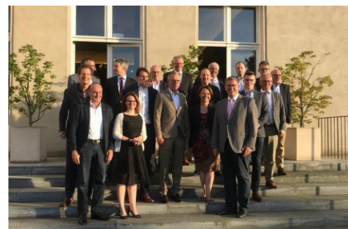
Gruppenbild vor der Schweizer Botschaft

In regelmäßigen Abständen tauschen wir uns mit unseren direkten Nachbarn aus der Schweiz aus. Dabei stehen zahlreiche grenzüberschreitende Themen wie z.B. der Verkehr auf der Tagesordnung. Als Mitglied der deutsch-schweizerischen Parlamentariergruppe und da mein Wahlkreis direkt an die Schweiz grenzt ist dies ein wichtiger Termin für mich.