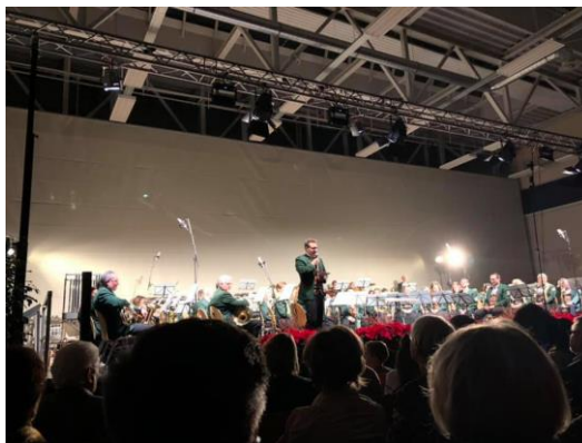
Beim Konzert in der Eriskircher Sporthalle

Am vergangenen Samstag war ich auf Einladung der Musikkapelle Eriskirch zu Gast beim traditionellen „Festkonzert zum Neuen Jahr“ in der Eriskircher Sporthalle. Über 500 Besucher verfolgten das sehr gelungene und abwechslungsreiche musikalische Feuerwerk , das die über 50 Musiker boten. Dabei reichte der Reigen