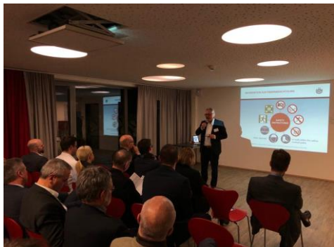
Bei der Diskussion mit dem Wirtschaftsrat

In der vergangenen Woche nahm ich an einer Veranstaltung der Sektion Friedrichshafen/Ravensburg des Wirtschaftsrats der CDU teil. Diese war eingebettet in einen Vor-Ort-Termin mit Unternehmensbesichtigung bei Wälischmiller Engineering in Markdorf . Im sich daran anschließenden Gedankenaustausch hielt ich einen Impulsvortrag zu den Perspektiven der Exportwirtschaft und den damit einhergehenden Herausforderungen für die Unternehmen. Diese – insbesondere aber Genehmigungen und Kontrollen im