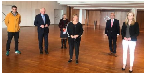
Mit Kultusministerin Susanne Eisenmann im Graf-Zeppelin-Haus in Friedrichshafen.

Am vergangenen Sonntag war die Spitzenkandidatin der CDU für die Landtagswahl im kommenden März zu Gast am Bodensee. Unter dem Motto „ Eisenmann will's wissen “ tourt die Kultusministerin von Baden-Württemberg aktuell durch das gesamte Bundesland und stellte sich im gut besuchten Graf-Zeppelin-Haus den kritischen Fragen der Bürgerinnen und Bürger. Diese konzentrierten sich zunächst auf Eisenmanns Zuständigkeitsbereich als Ministerin, genauer gesagt auf das Thema Unterricht in Corona-Zeiten .